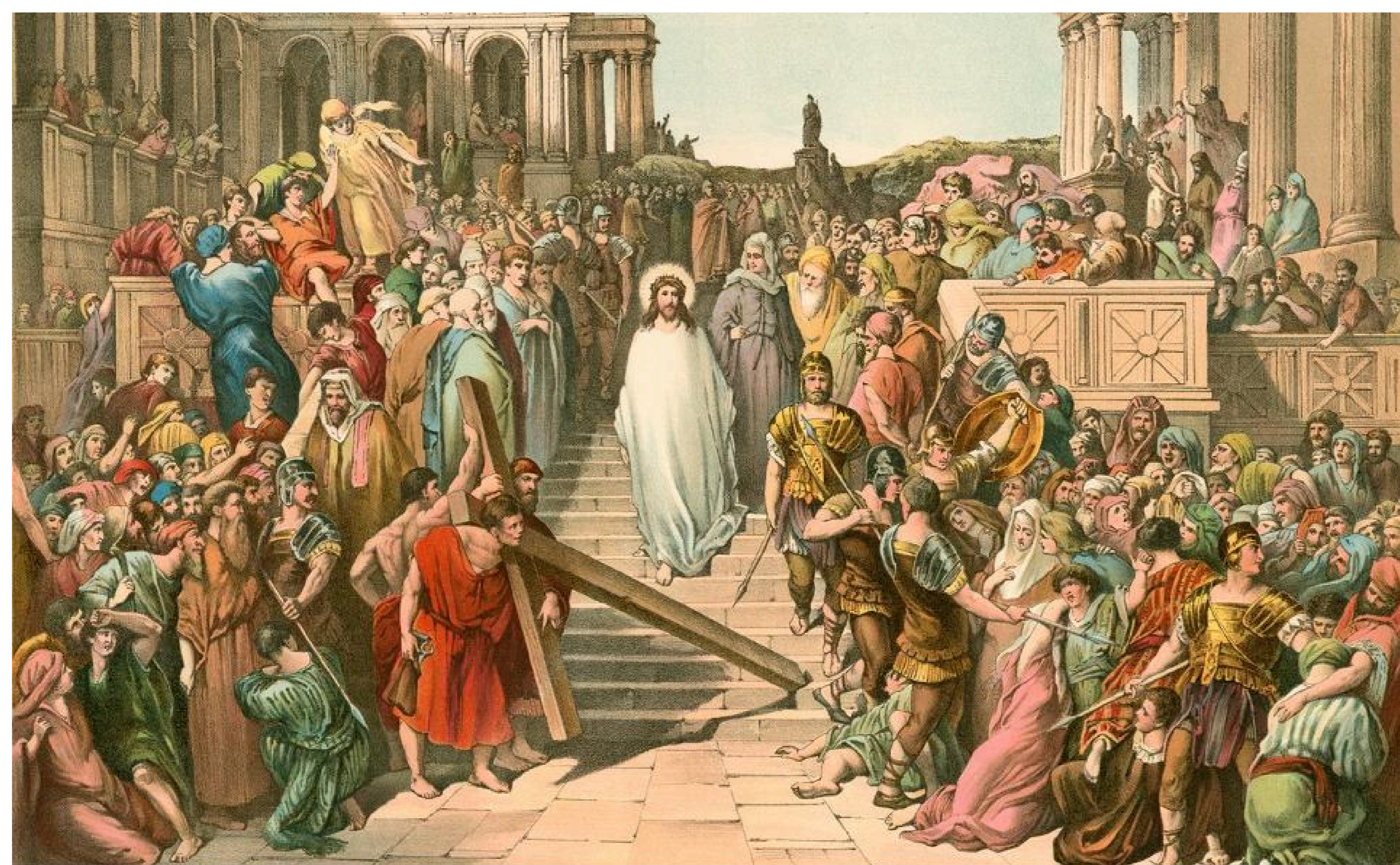
Gustave Dore "Gesù sulla via del Calvario"

Dio venuto tra gli uomini va al patibolo sconfitto. Questa è la condizione del sacrificio nel suo significato più profondo: sembra un fallimento, sembra che gli altri abbiano ragione. Il rimanere con Lui anche quando sembra che tutto finisca, rimanergli accanto come ha fatto Sua Madre; solo questa fedeltà ci porta, presto o tardi, all’esperienza che nessun uomo al di fuori della comunità cristiana può provare nel mondo: l’esperienza della Resurrezione. E noi siamo capaci di lasciarlo per altro amore questo Cristo che si inoltra nella morte per salvarci dal male”. “Lascieremolo noi per altro amore?”