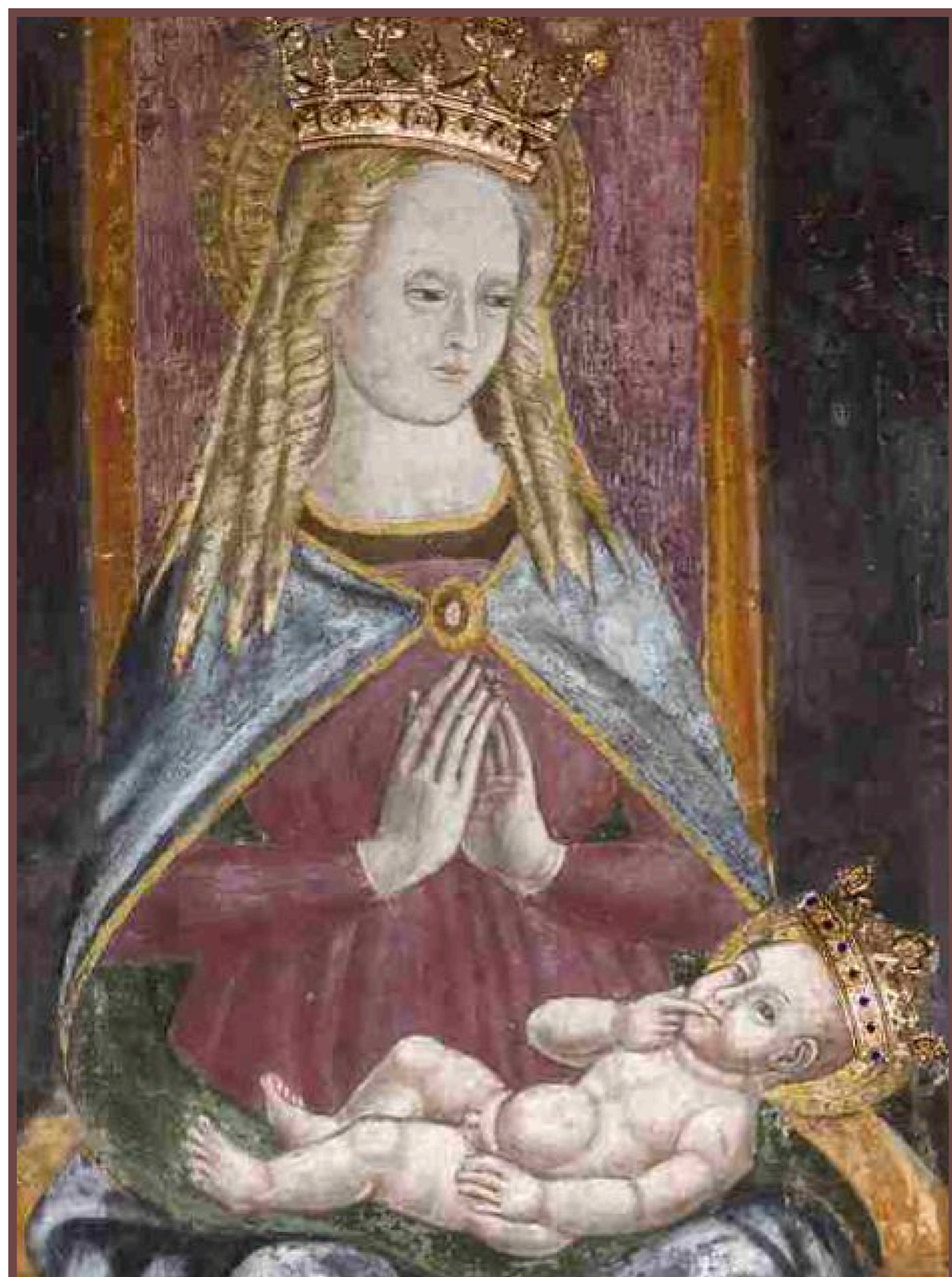
MADONNA DELLE LACRIME - Affresco Santuario dedicato alla Madonna delle Lacrime Treviglio (BG)