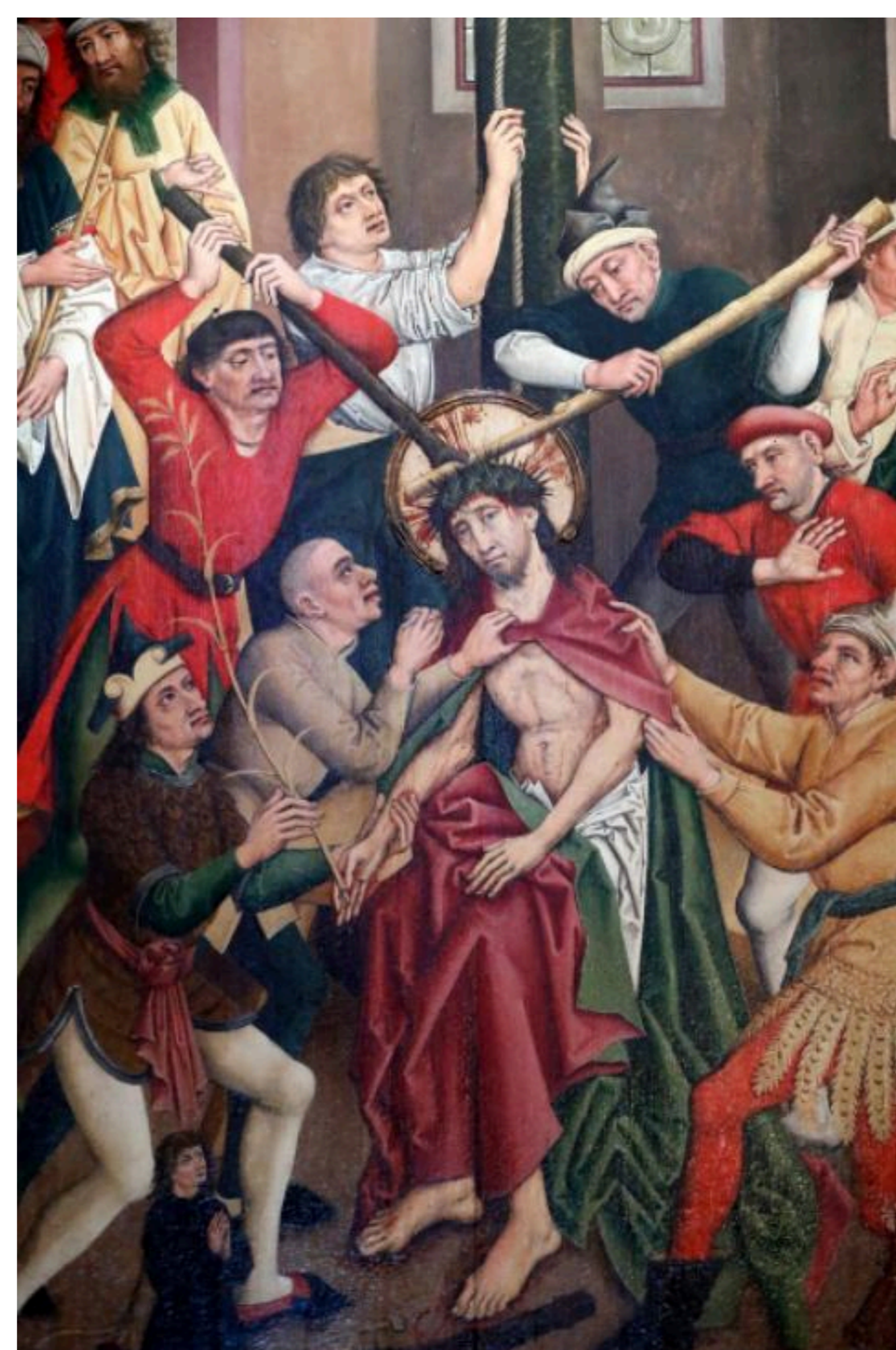
Henri Lutzelman "Gesù coronato di spine"

Quella piccola testolina, che la Madonna come ogni madre davanti al figlio neonato avrà stretto senza stringerla, accarezzata con delicatezza come fa ogni madre, guardata con stupore e ammirazione, sarebbe dovuta essere incoronata di spine. Come la Madonna risentiva in sé questo male del mondo, senza dettaglio e senza accuse, ma come dolore già sterminato che doveva culminare nello sguardo alla morte di suo figlio!