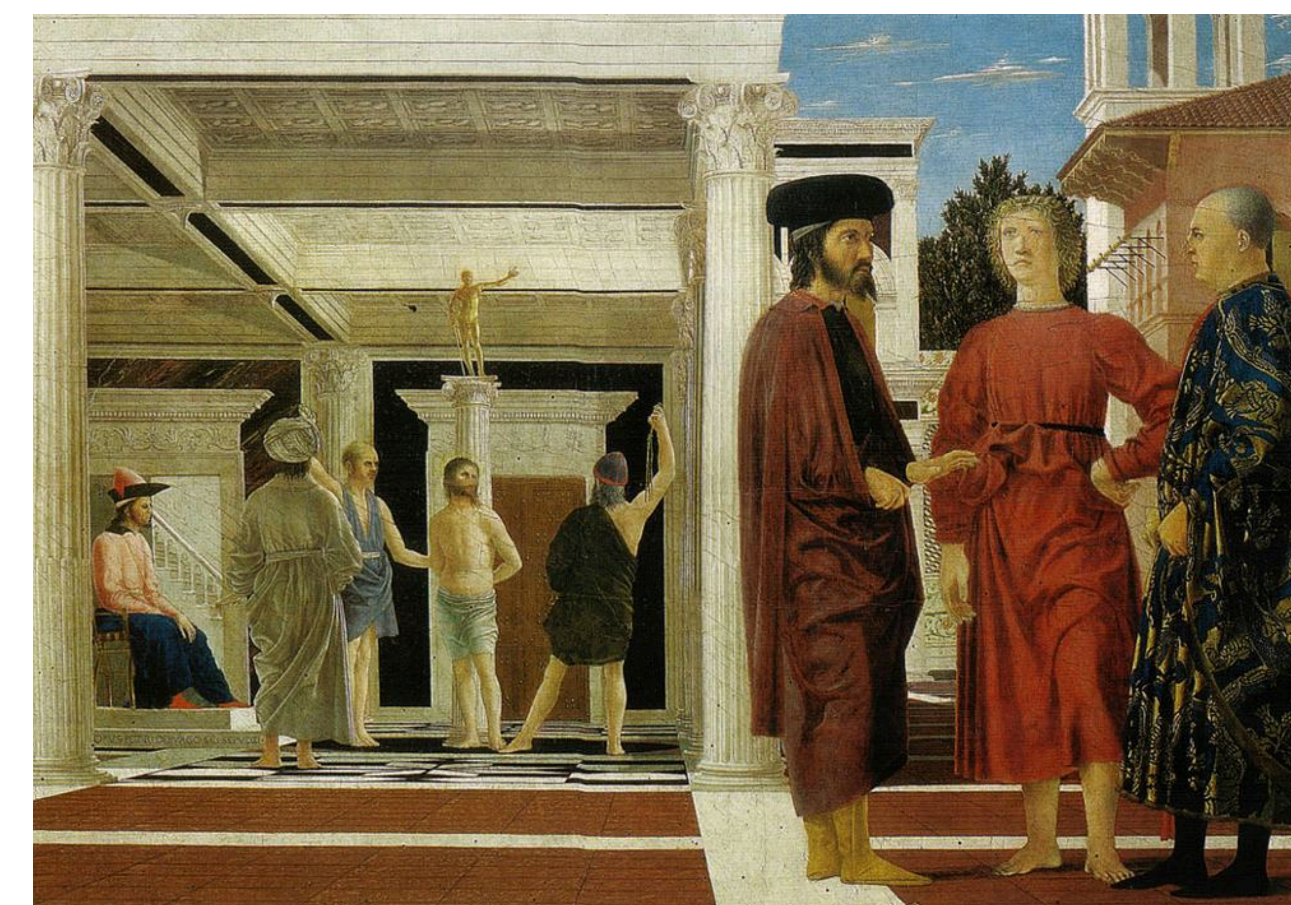
Piero della Francesca "Gesù flagellato"

Cosa faremo ora? Andremo via rifiutandolo nonostante quello che abbiamo visto e sentito? Del resto come sta finendo? E' lì, solo, umiliato. Tutta la sua forza, la sua potenza, la sua bellezza giacciono sotto i colpi della frusta. In tutti i secoli della storia non si può immaginare una tragedia più grande di questa: la compagnia di Dio fatto carne dimenticata, oltraggiata dall'uomo.