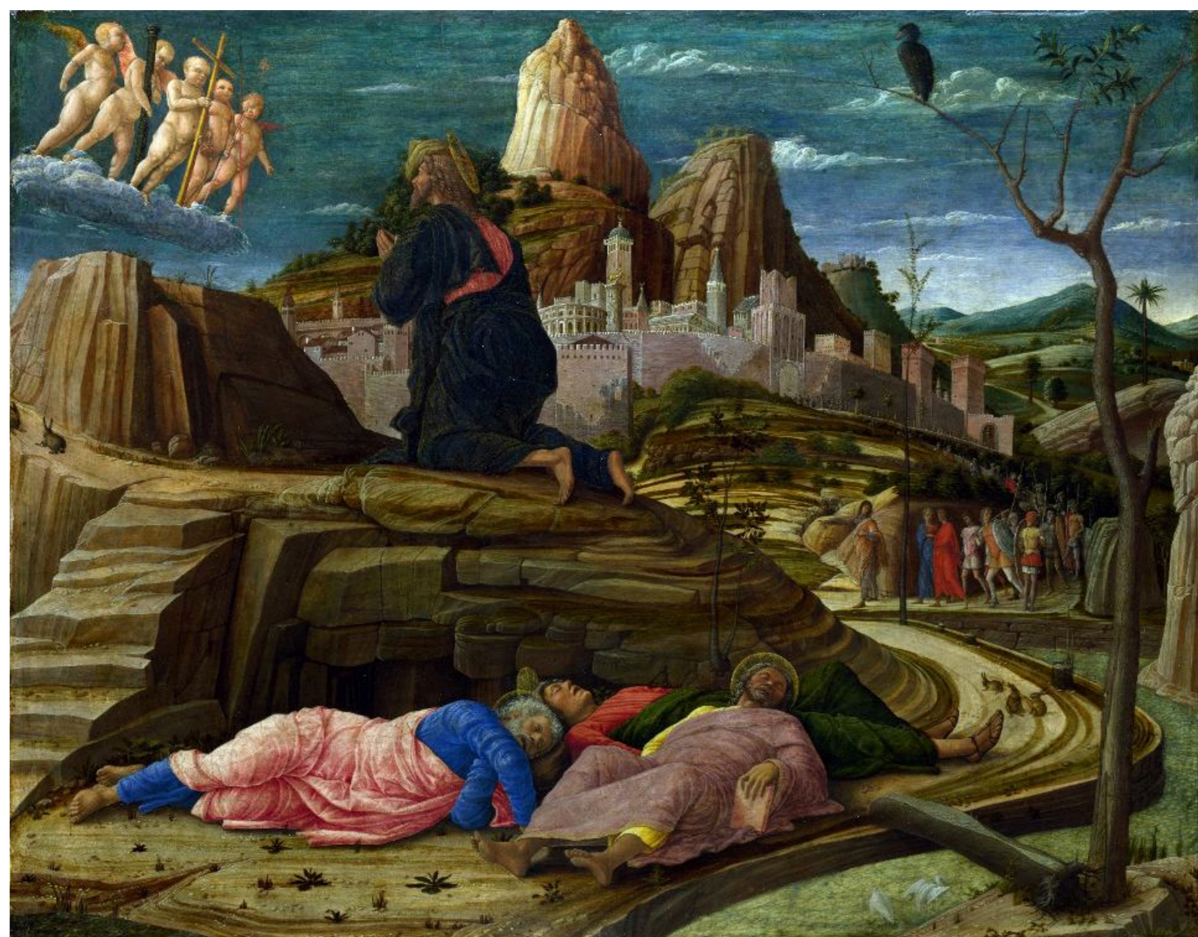
Andrea Mantegna "Orazione nell'orto degli ulivi"

Quante volte dovremo rileggere questo brano per immedesimarci con l'istante più lucido nel quale la coscienza dell'uomo Cristo, Gesù, si è espressa. “Padre, se è possibile, che io non muoia; però non la mia, ma la Tua volontà sia fatta”. E' la suprema applicazione del nostro riconoscimento del Mistero, aderendo all'uomo Cristo, inginocchiato e grondante sangue dai pori della pelle, nell'agonia del Getsemani: la condizione per essere vero in un rapporto è il sacrificio.