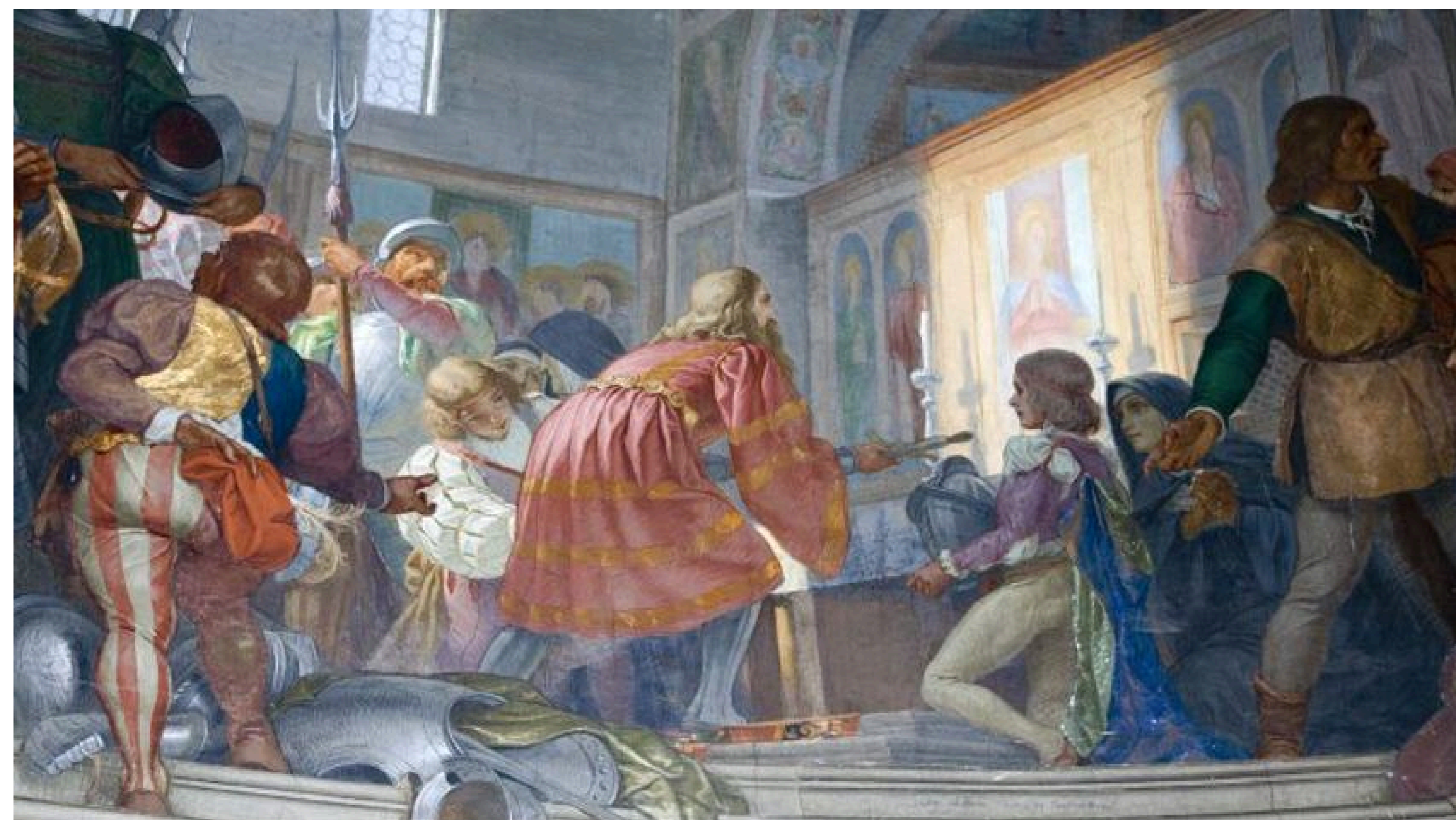
Affresco - GAETANO CRESSERI Santuario - Madonna delle Lacrime Treviglio (BG)